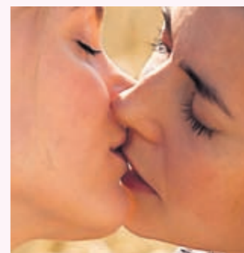
Beeld uit film 'Kiss Me'.

Alle vier gaan ze vaker de straat op, winkelen. Lange tijd kwam de groep in Hoorn in het verborgene bijeen in 't Hop. Sinds zon hebben ze een grote stap voorwaarts gezet door de 3e woensdag van de maand naar een openbaar café te gaan: Het Kantoor van de Buurman. Meer informatie: tent-werkgroephoorn.nl